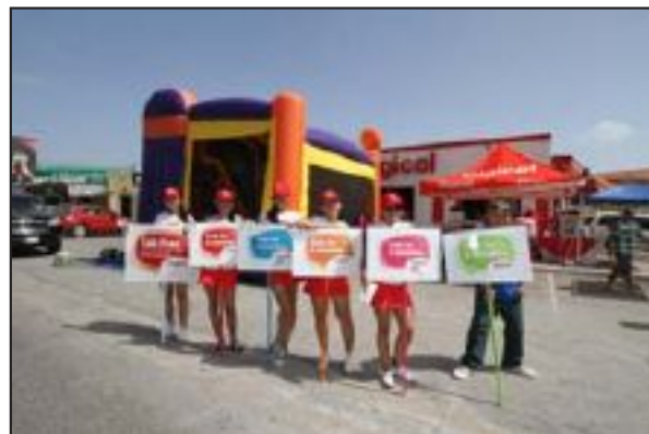
Siman pasa na Tanki Leendert e tabata un exito rotundo